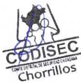
Cuadro n.º 40: Fiscalizar el cumplimiento de horarios de apertura y cierre de discotecas, bares, pubs y establecimientos con giros comerciales afines, a nivel distrital