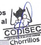
Cuadro n.º 42: Operativos de fiscalización en el cumplimiento de protocolos de seguridad sanitaria, en los diferentes rubros comerciales y de atención al cliente, para prevenir la propagación del COVID-19