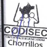
Cuadro ni. 36: Implementación de los mecanismos de rendición de cuentas públicos trimestrales sobre acciones y resultados de política local de seguridad ciudadana